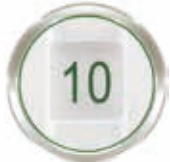
ペネトレーションデプス インジケータ (例) 10mm