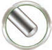
ブラントチップ スタイレット