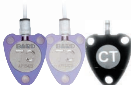
(反転したポートの状態)