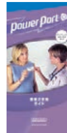
患者さま用ガイド