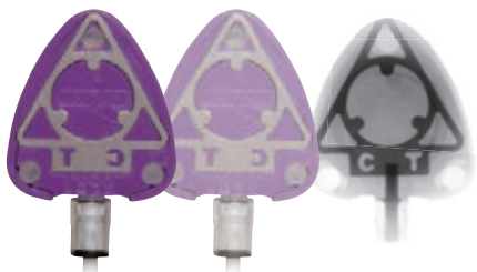
(反転したポートの状態)